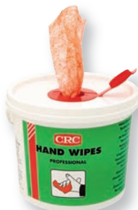
TOALLITAS Toallitas limpiadoras